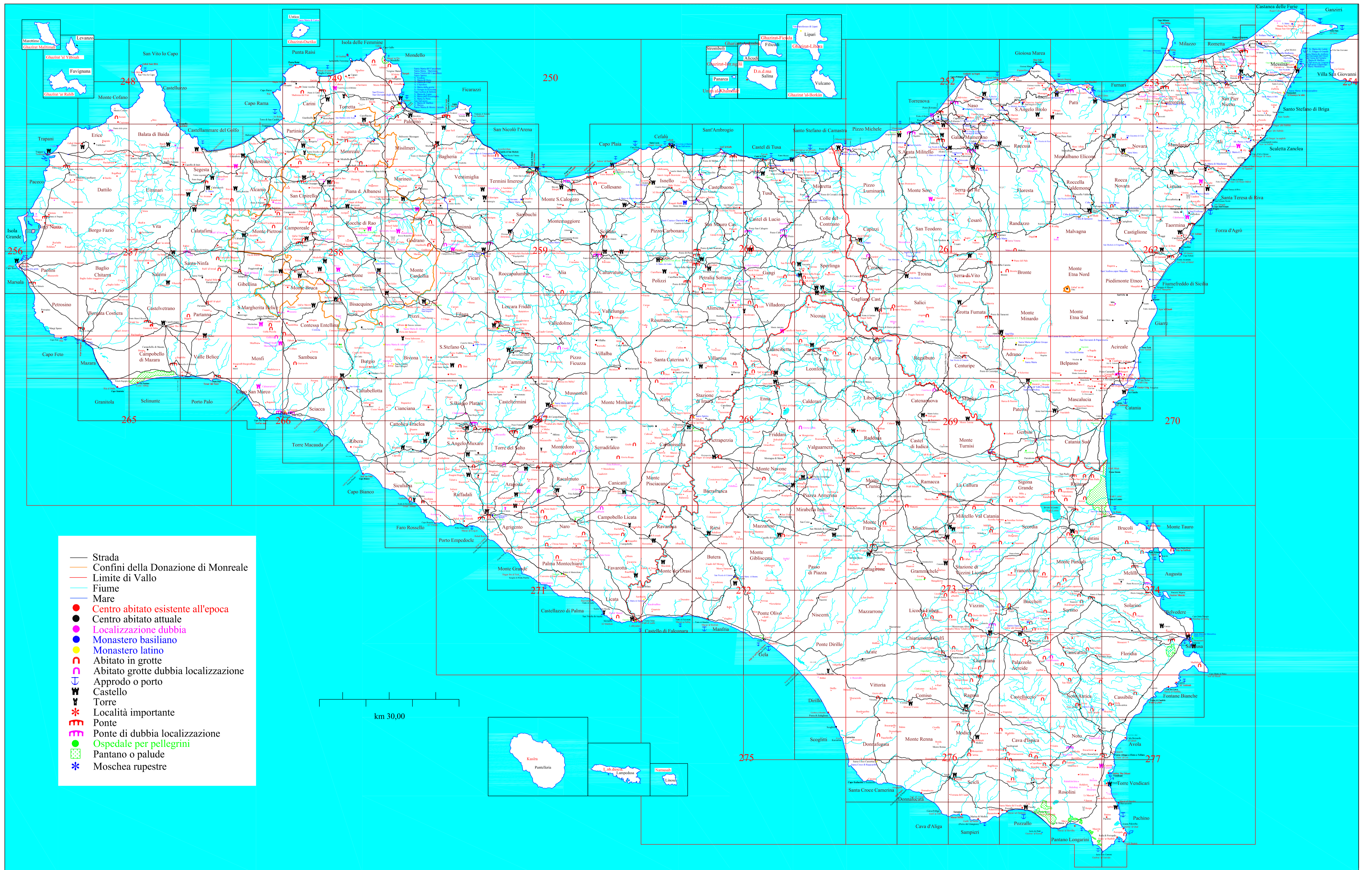
Tavola 1 Quadro generale